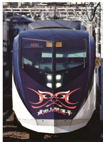
「成田山開運号」イメージ