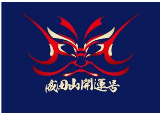
ヘッドマークデザインイメージ

また、大晦日の終夜運転時と正月三が日および1月中の土曜・休日には、多くの参詣客で賑わう成田山新勝寺への初詣列車として、スカイライナー車両を使用した座席指定で快適・便利な 成田山開運号 を運行いたします。初詣のみならず、行楽地へのお出かけ等、多くのお客様のご利用を心よりお待ちしております。