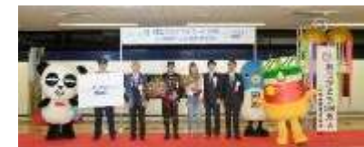
2000万人達成記念式典