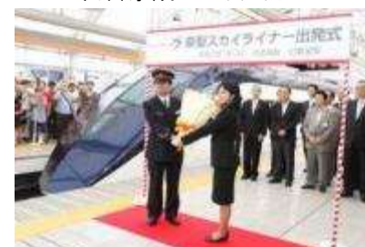
3代目京成スカイライナー出発式