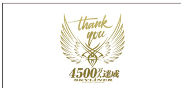
記念ヘッドマーク