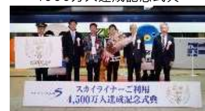
4500万人達成記念式典