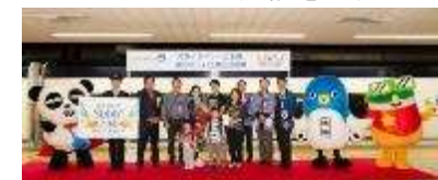
3000万人達成記念式典