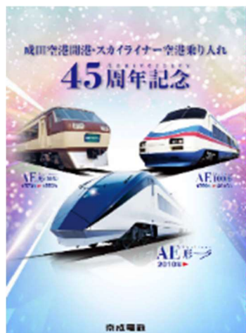
ノベルティグッズ（クリアファイル）