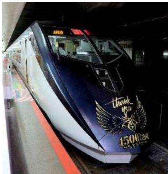
4500万人達成記念ヘッドマーク を掲出したA形車頭