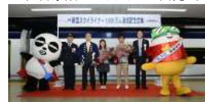
1000万人達成記念式典