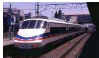
2代目京成スカイライナー