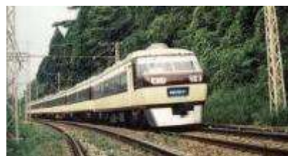
初代京成スカイライナー