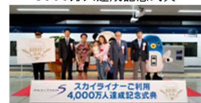
4000万人達成記念式典