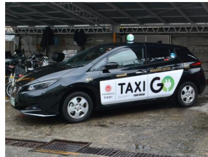
日産 リーフ e+X