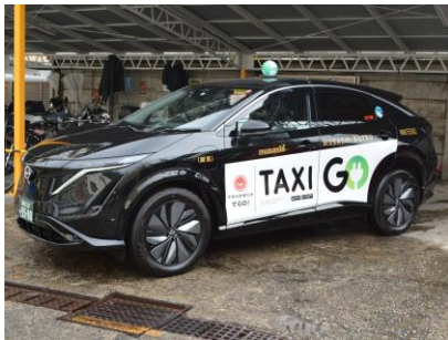
日産 アリア B6