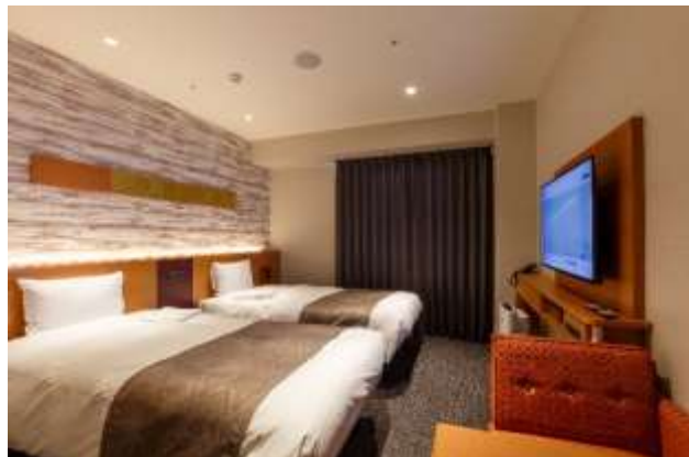
抽選で当たる客室 例:アネックスツイン

今回が初の開催となる「イースターエッグハント」は、ヒントをもとにホテル館内と千葉中央駅周辺施設に設置されたイースターエッグを探し、キーワードを集めた先着85名様に賞品が当たり、さらに抽選で宿泊券等が当たる体験型イベントです。京成千葉中央ビルのグランドオープンから半年を迎え、さらに多くの皆様に千葉中央エリアに親しんでいただくため、周辺に所在する京成グループ各社と連携して開催しています。