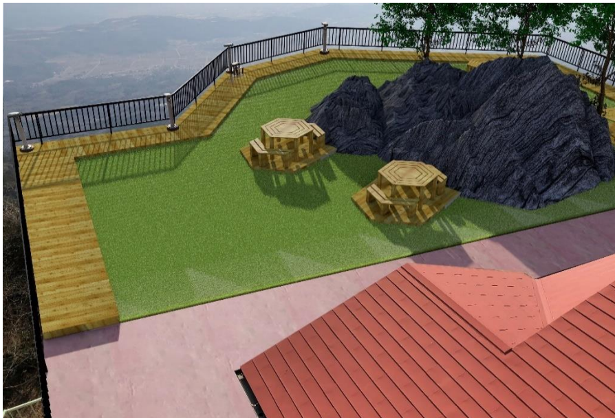
<展望台リニューアルイメージ図>

筑波山ロープウェイ展望台および付設レストランは、ロープウェイが開業した1965年8月に開設されて以来、今回が初のリニューアルとなります。アフターコロナにおける観光需要の回復を見据え、「自然との調和」・「くつろぎ(滞在性)」をテーマに、筑波山にお越しの方がゆったりと関東平野の景色をお楽しみいただけるような空間を提供いたします。また、リニューアルを記念して当日はイベントも開催いたします。