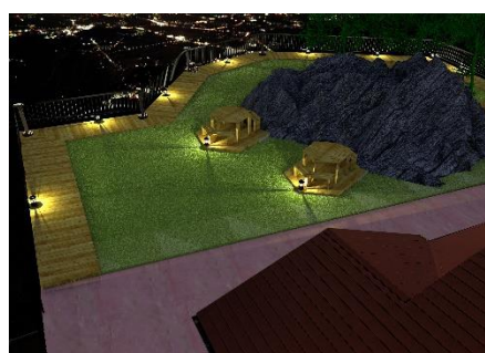
<展望台リニューアルイメージ図>