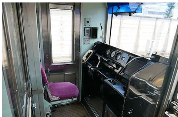
3400形運転台

器類、表示灯類、車掌スイッチ、車掌台などに触れることができる、当ホテルでしか体験できない特別な仕様を計画しております。