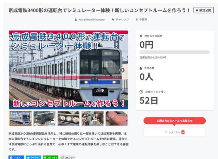
クラウドファンディングサイト「CAMPFIRE」

本物の運転台で運転体験シミュレーターができ、より多くの鉄道ファンの皆さまにご満足いただけるような新しいコンセプトルームを実施するために、クラウドファンディングサイト「CAMPFIRE」にて2023年7月15日(土)よりプロジェクト支援を募集いたします。