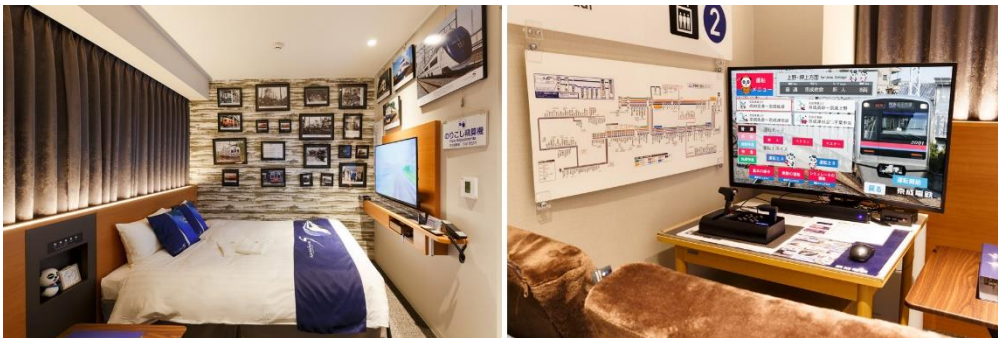
現在販売中の京成トレインルーム、運転体験シミュレーター

当ホテルは、昨年2022年9月に開業20周年を迎え、記念プロジェクトのひとつとして、別館である京成ホテルミラマーレアネックスにて、京成電鉄をテーマにしたコンセプトルーム「京成トレインルーム」を2022年7月から販売してまいりました。そして、ご宿泊いただいた多くのお客様からの「シミュレーターが欲しい！」という熱いご要望にお応えすべく、京成電鉄にて新たに開発した運転体験シミュレーターを設置、一部展示品もリニューアルし、更に“鉄分”アップした新たな宿泊プランとして本年2023年4月から販売し、こちらも多くのお客様からご好評をいただいております。