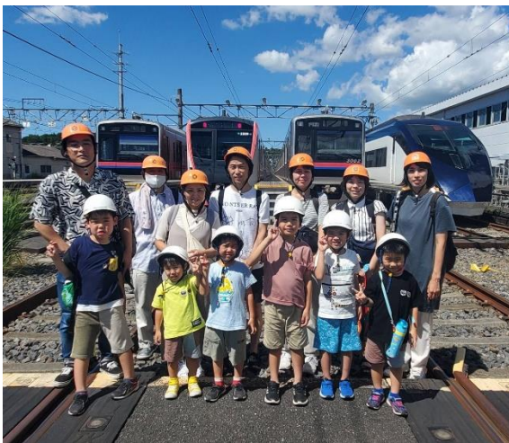
車両基地での集合写真