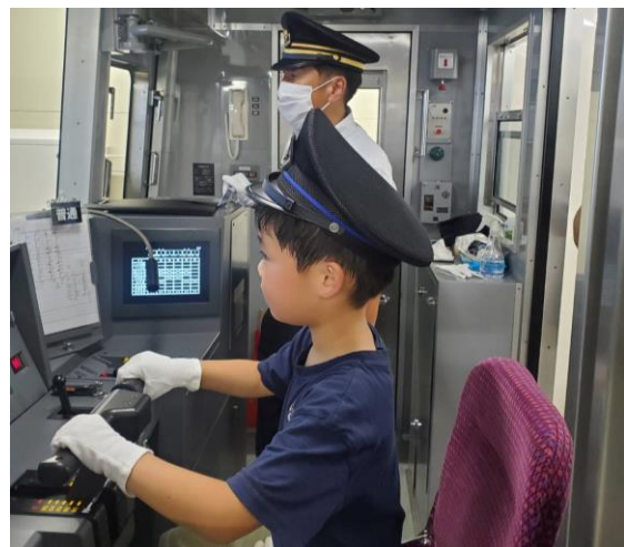
運転シミュレータ体験の様子