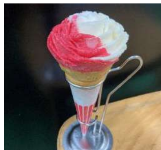
赤白バラ盛りジェラート (土日祝各日10個限定)

今回のイベントに合わせ、園内の店舗では「不思議の国のアリス」をイメージしたオリジナルのコラボメニューを期間限定でご提供します。園内出店のキッチンカー da Luciano(ダルチアーノ)では、フランポワーズと洋ナシソルベの2色のジェラートで作る「赤白バラ盛りジェラート〜バラの花を赤く塗ろうよ〜」とミルクとキャラメルのジェラートに耳の形をしたチョコレートをあしらった「ネコ耳ジェラート」を販売します。どちらも期間限定、京成バラ園内でしか購入出来ないジェラートです。