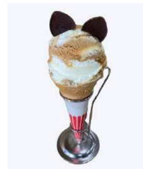
ネコ耳ジェラート