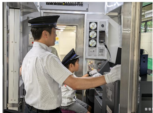
運転シミュレータ体験の様子