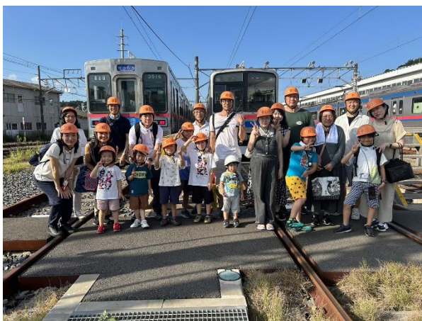
車両基地での集合写真