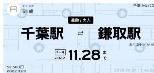
スマホ定期券画面イメージ(千葉中央バス)

また、千葉中央バスでは、2022年10月1日より路線バス通勤定期券について RYDE 株式会社(本社:東京都渋谷区)運営のスマートフォンアプリ「RYDE PASS」を活用し、スマートフォン上で発売します。