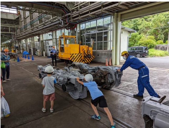
車両基地見学の様子