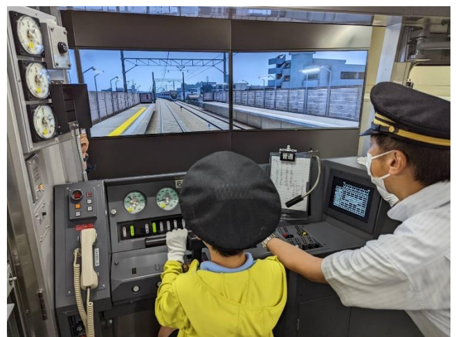
運転シミュレーター体験の様子