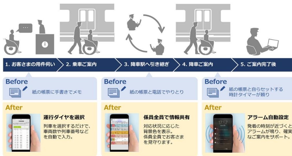
本サービスの概念図（※画面ははめ込み画像です）

本サービスでは、経路(列車番号)や乗車位置、車いすの場合はその種類(手動・電動)などの情報を乗車駅側がスマートデバイスに入力することで、降車駅側にプッシュ通知で連絡が入ります。従来は電話による口頭伝達に頼っていた一連の連絡業務をスマートデバイス上で完結することができるため、スムーズに乗降駅間の連携が可能となります。従来の列車乗降サポートの業務フローに沿った機能が提供されているため、現場目線でも使いやすく、駅係員の作業時間が短縮されることで、鉄道利用者のより円滑かつ安全安心な移動の実現に貢献します。