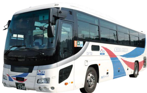
マイタウンダイレクト高速バス(イメージ写真)