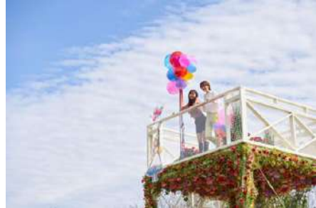
※昨年のイメージです

庭園を見渡すことができる高台に秋限定の『ハートの女王の展望台』が登場します。展望台の上からは、庭園のバラを通常の見線よりも3m以上高い位置から眺めることが出来るだけでなく、目の前の整形式庭園で開催される「アリスのクロッケー」を観戦することも出来ます。また展望台の下にはアートフラワーでデコレーションされた『アリスのブランコ』も設置されます。