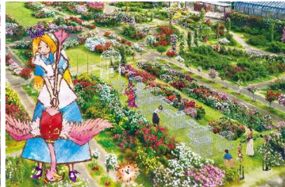
アリスのクロッキー

【初開催】「不思議の国のアリス」の人気シーン「マッドハッターのお茶会」を 若手声優らが扮する執事が再現