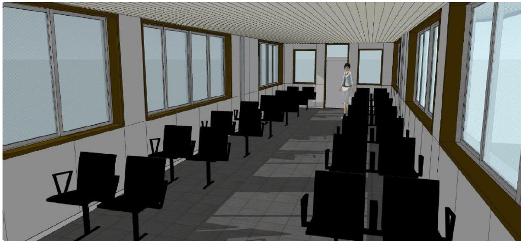
青砥駅ライナー待合室 内装

京成電鉄では、お客さまに快適に駅をご利用いただけるよう、これからもサービス向上に努めて参ります。