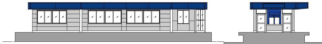
青砥駅ライナー待合室 外装（左：側面、右：正面）