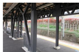
▲耐震補強工事(東中山駅)