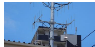
▲地上基地局 アンテナ