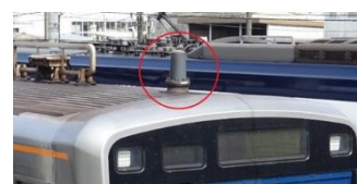
▲車上設備 アンテナ