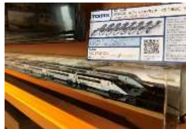
▲ 最新型Nゲージ 「TOMIX 京成電鉄 AE形 (スカイライナー・第7編成)セット」