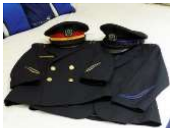
▲ お子様用制服の貸出