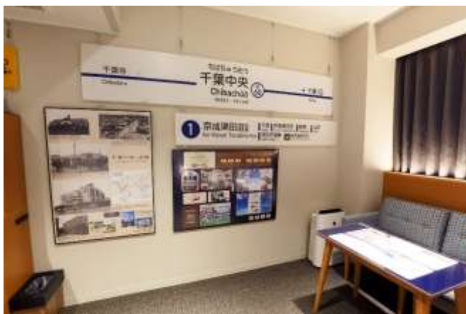
▲ 駅看板や記念乗車券などの展示