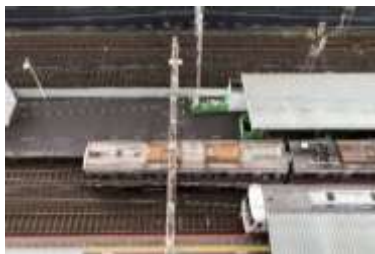
▲ 客室窓からのトレインビュー