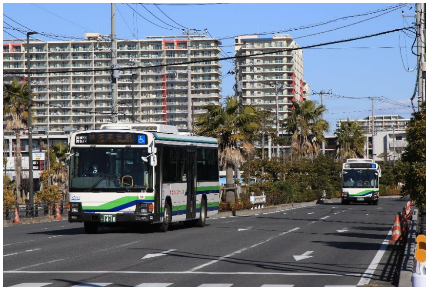
高洲地区を走る路線バス車両