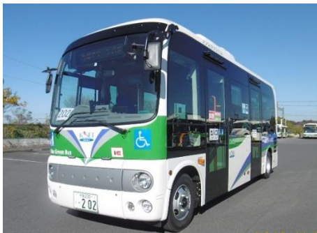
ちばグリーンバス(イメージ車両)

ちばグリーンバスでは、佐倉ふるさと広場におけるチューリップ(春)・ひまわり(夏)・コスモス(秋)の見頃に合わせて、臨時直行シャトルバスを運行しておりますが、この夏も、「ひまわり号」の愛称を付けて運行します。