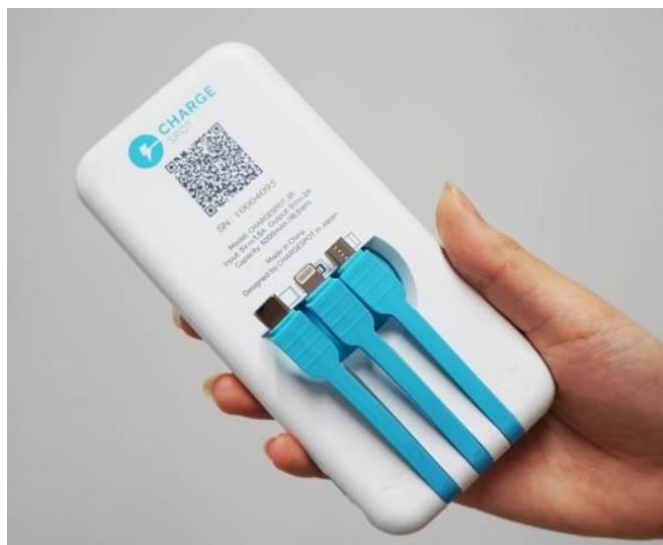
「モバイルバッテリー」