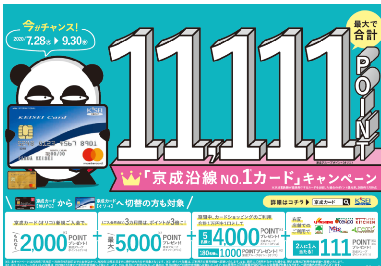
キャンペーンポスター(イメージ)