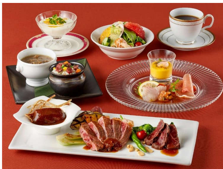
土日祝限定！ かずさ和牛の鉄板焼きランチコース