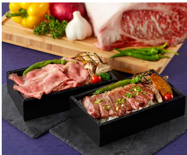
かずさ和牛と粒すけのステーキ重、かずさ和牛と粒すけのローストビーフ重