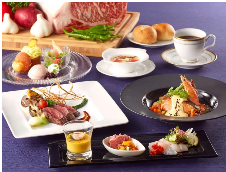
9・10月のミラーチェ ～かずさ和牛 秋味のコース～