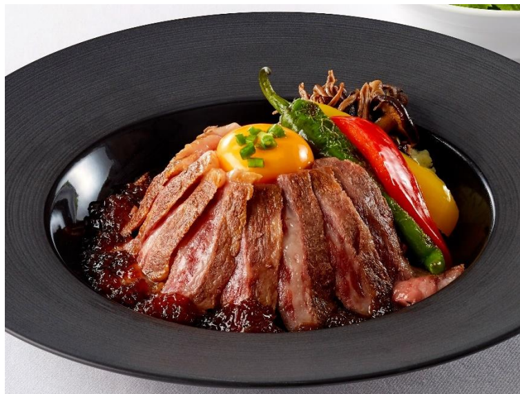
かずさ和牛と粒すけのステーキボール