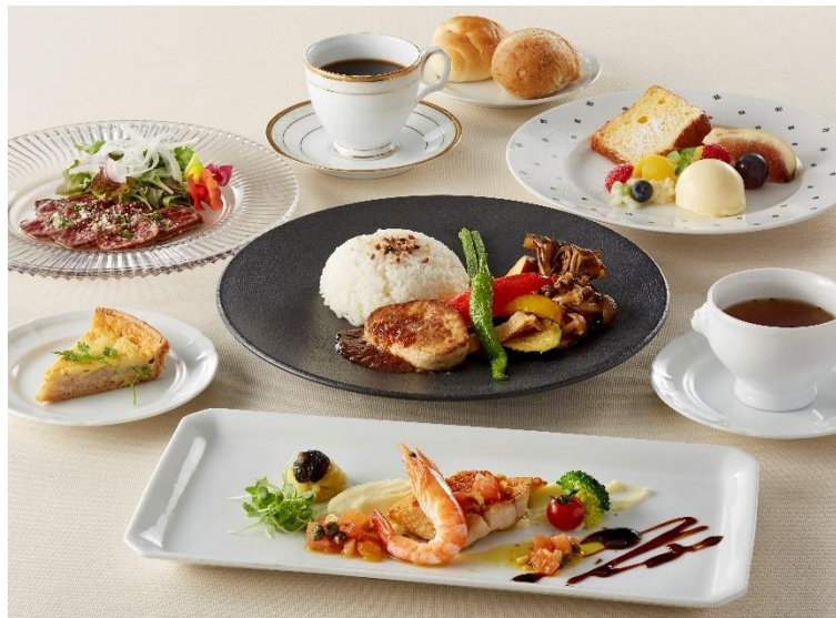
野菜ソムリエランチコース ～粒すけと秋野菜の共演～