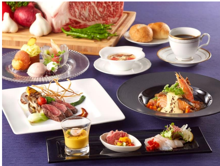
9・10月のミラーチェ ～かずさ和牛 秋味のコース～