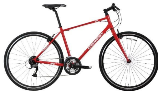
「KhodaaBloom(コーダーブルーム)」

さらに、「スポーツバイク」で東京都心を存分にお楽しみいただけるよう、おすすめモデルコースを23コースご用意し、お貸出し時に係員がご案内することで、行先に迷われている方でも安心して都心の「サイクルトラベル」をお楽しみいただけます。また、お貸出し場所が手荷物預かり所であることを活かし、レンタサイクルご利用時間中の手荷物の預かりを承ります。