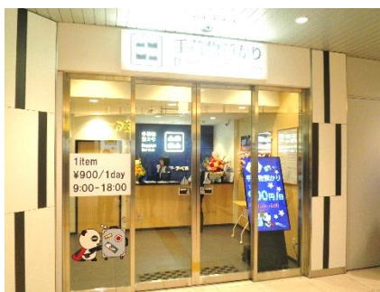
京成上野手荷物カウンター

お貸出しする「スポーツバイク」は、ホダカ株式会社製の「KhodaaBloom(コーダーブルーム) RAIL700」で、日本人の体型に合わせたフィッティング性の高さが特徴の人気スポーツバイクです。ご利用される方の身長に合わせて3サイズをご用意いたしました。