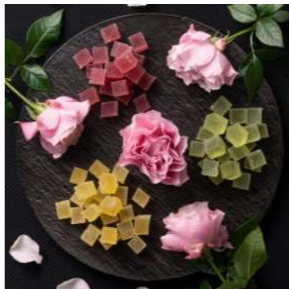
バラ「さくらドレス」 (京成バラ園芸作出)

和菓子の商品開発とバラの品種開発、両社の生み出す仕事に携わる女性スタッフがタッグを組み、日常を特別に変える和菓子というコンセプトで、女性が喜ぶ要素を盛り込んだ和菓子を開発しました。