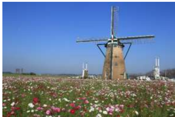
秋の佐倉ふるさと広場