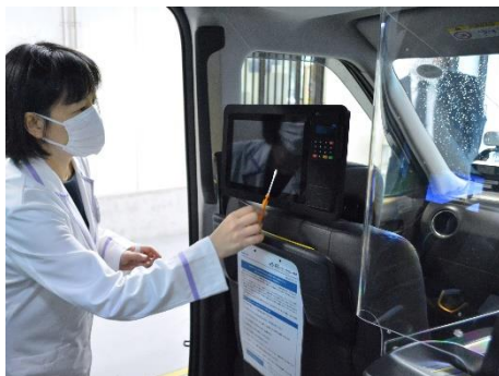
タクシー車両の衛生状態のチェック