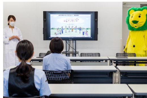
衛生マイスターによる出張清潔衛生授業(予定)

本プロジェクトは、ライオンが『キレイのりレー』と題して「大切な誰かを想い、清潔衛生行動をとる」ことで、人との触れ合いにあふれた社会を目指す」という趣旨で進めているものです。当社は、「人と人をつなぐ架け橋に」という企業理念のもと、「人の移動」を安全かつ快適にお手伝いし、人々に真の豊かさを提供することを目指しています。この度、「大切な誰かを想い、清潔衛生行動をとる」ことを、ひとりひとりが“りレー”のようにつなげていくという趣旨に賛同し、協働して推進してまいります。