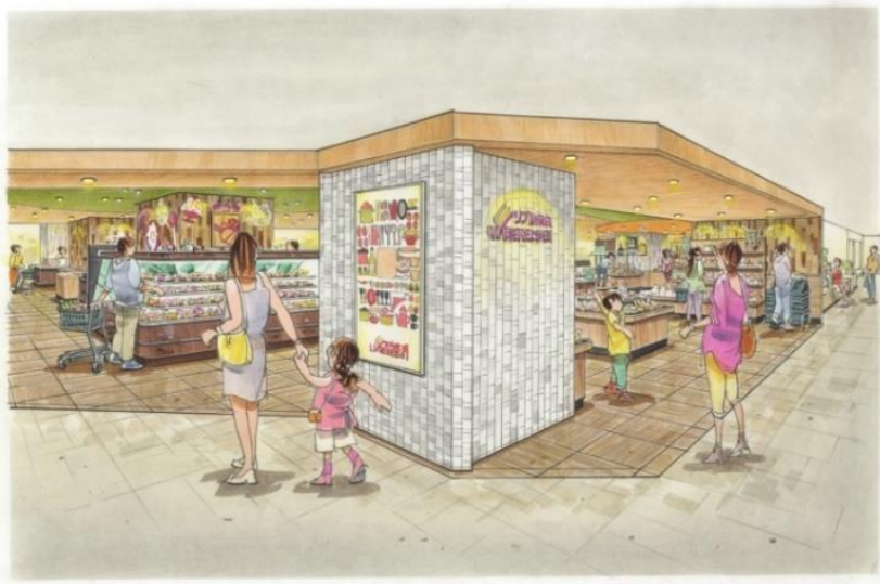
リブレ京成千葉中央店イメージ