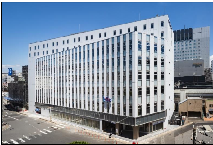
京成千葉中央ビル