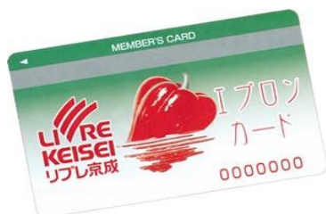
入会金・年会費無料のエプロンカード