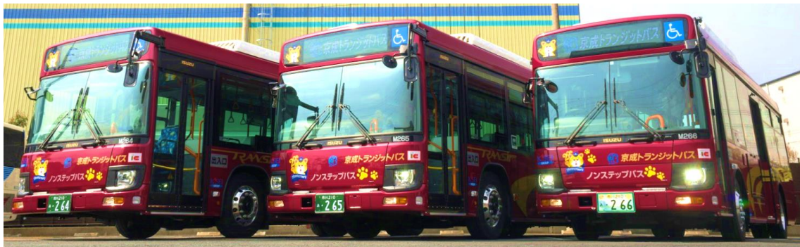
京成トランジットバス 路線バス車両