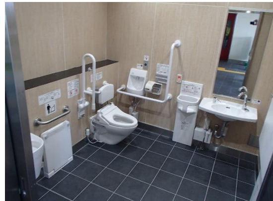
バリアフリートイレ