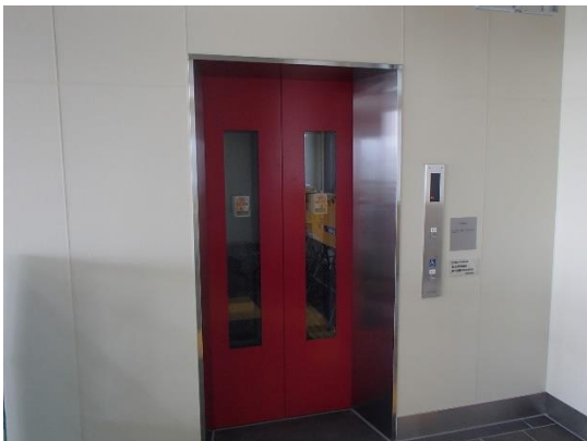
改札内エレベーター