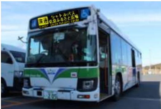
ちばグリーンバス車両