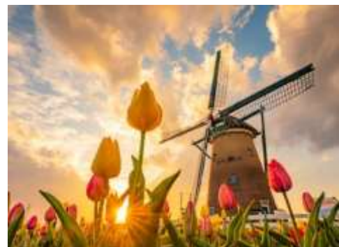
佐倉チューリップフェスタ