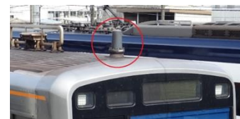
▲車上設備 アンテナ