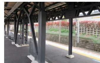
▲耐震補強工事(東中山駅)