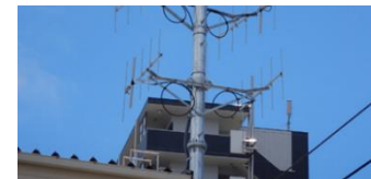
▲地上基地局 アンテナ